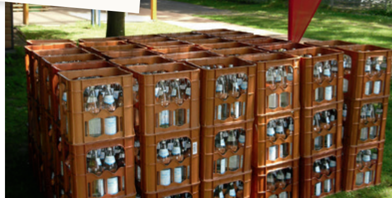
Ein Kubikmeter Getränke wurde von uns gespendet.

Für die drei Politiker Maria Flachsbarth (CDU), Silke Lesemann und Matthias Miersch (beide SPD) hatte die erfolgreiche Aktion ein Nachspiel: Sie verloren ihre Wette (...dass die Schule ihr Ziel nicht erreicht) und müssen dort nun soziale Stunden ableisten.