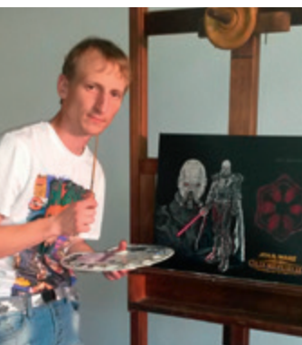
Dieses Star-Wars-Bild hat sich sein Sohn gewünscht.

Der Grünkolonnenführer, seit August 2007 für die Stadtwerke tätig, ist als gelernter Gärtner der Fachmann im Team. Vor allem, wenn es um allgemeine Garten- und Grünflächenpflege geht oder bei speziellen Themen wie Kettensägearbeiten und Wildkrautbekämpfung.