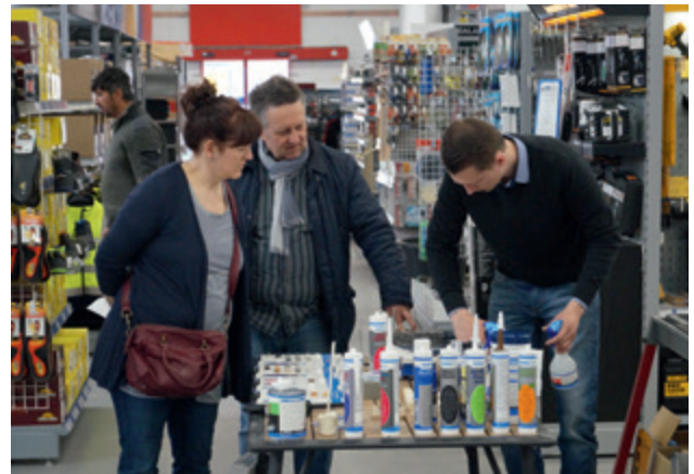
Auf die persönliche Kundenberatung wird großen Wert gelegt.

Als Mitglied einer der größten und leistungsstärksten Fachhandelskooperationen, der Eurobaustoff, kann das BHS Bauzentrum durch Umsatzbündelungen von über 1250 Fachhandelsbetrieben entsprechende Einkaufsvorteile zum Vorteil seiner Kunden nutzen. Weit über 4.800 Transportfahrzeuge im Dienste der Eurobaustoff – vom Kleinbus bis zum 38-Tonner mit Ladekran und Hubwagen – garantieren einen schnellen Lieferservice.