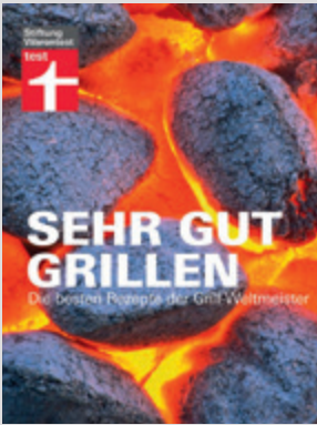
Grillen wie die Weltmeister.

Um sehr gut zu grillen, braucht man mehr als Glut, Fleisch und Bier. Exklusiv stellen in diesem Buch die amtierenden Grill-Weltmeister ihre besten Rezepte vor. Viel knackiges Gemüse wandert auf den Grill. Und selbst altgediente Griller werden überrascht sein: Thai-Austern über der Glut geröstet? Pizza und Flammkuchen vom Grill? Beer-Can-Chicken? Daneben erfährt man alles über die Auswahl des richtigen Zubehörs wie Grill, Kohle, Anzünder und über die besten Grillmethoden. In diesem Kochbuch der Stiftung Warentest sind über 100 exklusive Rezepte der amtierenden deutschen Grill-Weltmeister