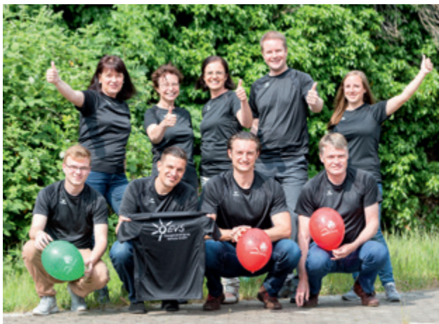
Zum ersten Mal sind wir mit dabei beim Hannover Firmenlauf – hier ein Teil unserer Mannschaft.

EVS mit dabei beim diesjährigen Hannover Firmenlauf am 9. September