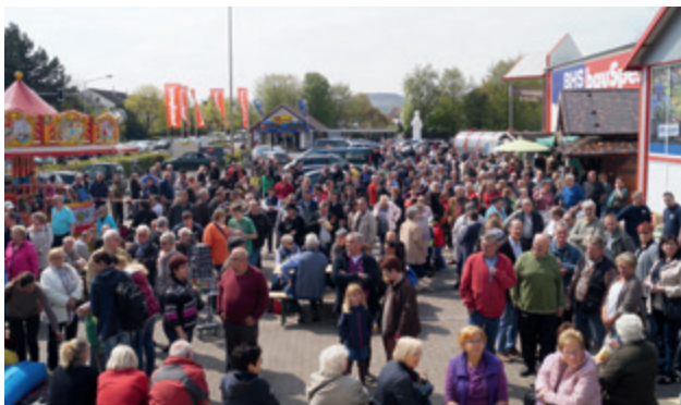
Da war was los – bei der Neueröffnung im April.

Viel Erfahrung, stetige Weiterbildung, kunden- und preisorientiertes Denken gepaart mit einer einzigartigen Servicepalette machte das BHS Bauzentrum zu dem was es heute ist – einer der größten ortsansässigen Arbeitgeber mit dem richtigen Warensortiment sowohl für Profi- als auch Privatkunden.