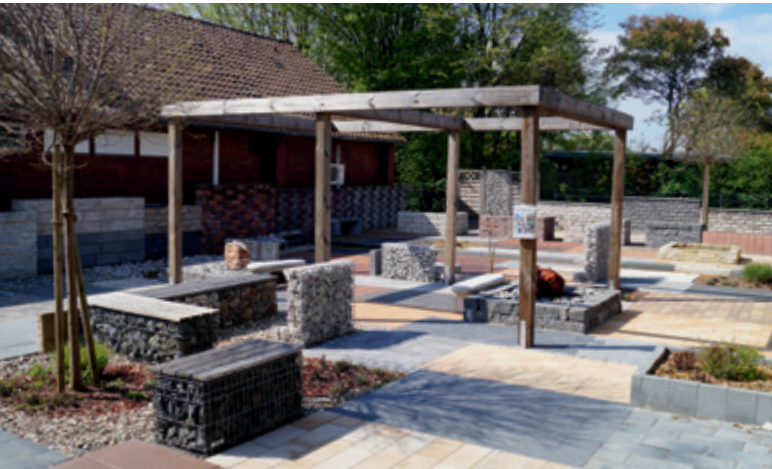
Auch in puncto Gartengestaltung gibt es viel zu sehen.

Unser Kunde BHS Bauzentrum: ein spannendes und innovatives Unternehmen