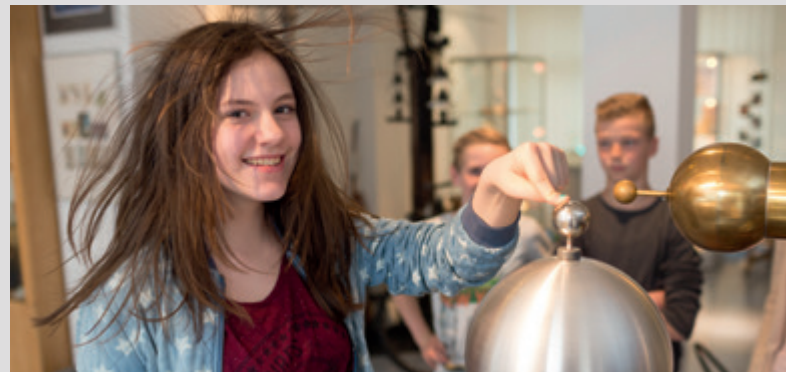
Bei diesem Experiment stehen dank Elektrizität die Haare zu Berge.

Das Staunen über die technischen Details und die Erkenntnis, dass sich in jeder Erfindung auch stets ein Stück Sozial- und Zeitgeschichte widerspiegelt, machen den besonderen Reiz dieser im Jahr 1979 gegründeten Ausstellung aus. Besonders die alltäglichen Geräte, die so mancher Besucher noch aus der eigenen Anwendung kennt, faszinieren oder regen zum Schmunzeln an. Zum Beispiel frühe elektrische Brotröster, nostalgisch anmutende Staubsauger, Holzbottichwaschmaschinen oder Heißluftduschen, die man heute als Fön kennt.