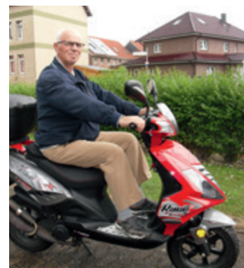
Flott unterwegs – hier mit der Explorer Race GT 50.

Seit Mai 2011 „der Mann für alle Fälle“ bei den Stadtwerken – der gelernte Maurer kümmert sich zwar auch um die Grünpflege, aber natürlich hauptsächlich um die Maurer- bzw. Klinkerarbeiten und ums Pflastern. 2014 war er für den kompletten Hoch- und Klinkerbau des Anbaus der Pumpstation Köthenwald zuständig. Sein großes Hobby sind Motorroller – damit erledigt er alle Wege: von der Arbeit bis zum Einkaufen.