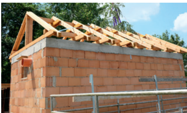
Der Pumpwerksoberbau erhält eine Verschalung aus Lärchenholz.

Anfang Juli verschickt der Netzbetreiber Avacon spezielle Postkarten, auf denen unsere Kunden die abgelesenen Strom- und Gaszählerstände eintragen und portofrei zurück senden können. Die Zählerstand-erfassung kann aber auch online auf der Avacon-Homepage vorgenommen oder per Smartphone über den angedruckten QR-Code übermittelt werden.