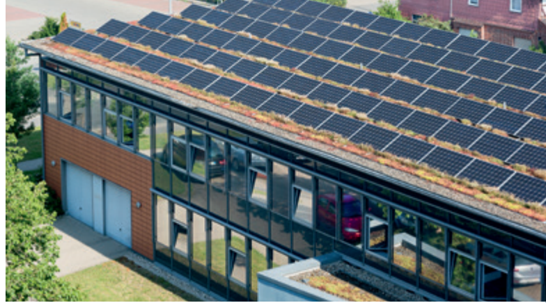
Auch auf dem Dach des Rathausanbaus installierte die Infrastruktur Sehnde eine PV-Anlage.

Beim Unwetter im Juli 2013 wurden die Anlagen der KGS Sehnde und der